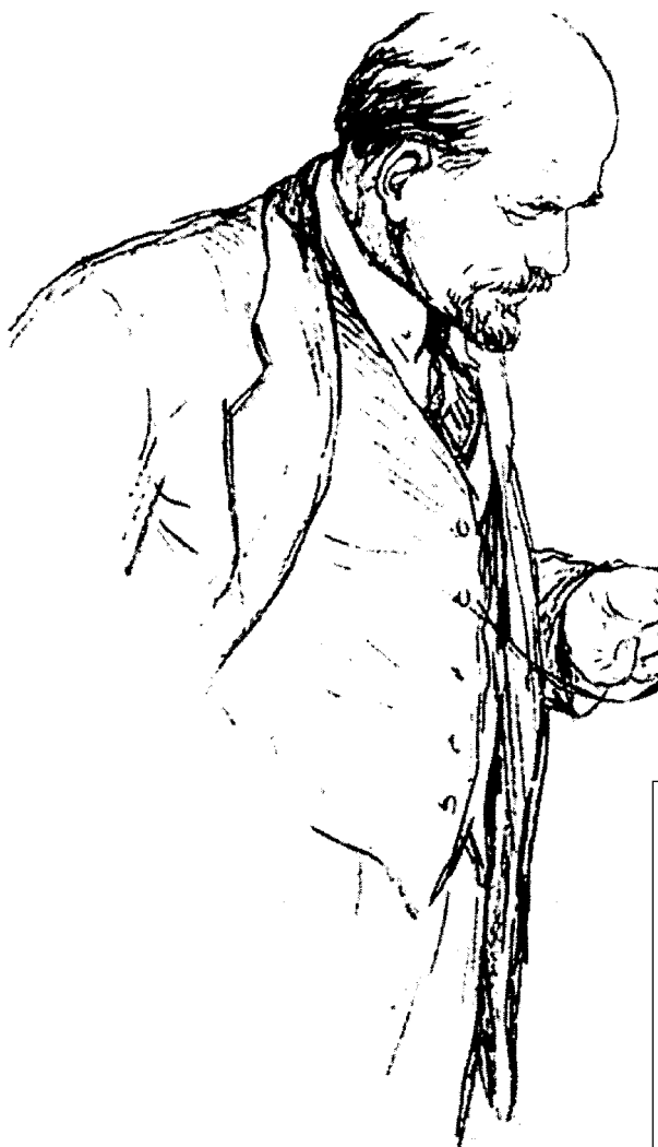
Zukov Nicolaj Nicolaevic, «È l'ora» (1959)