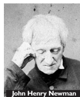
John Henry Newman